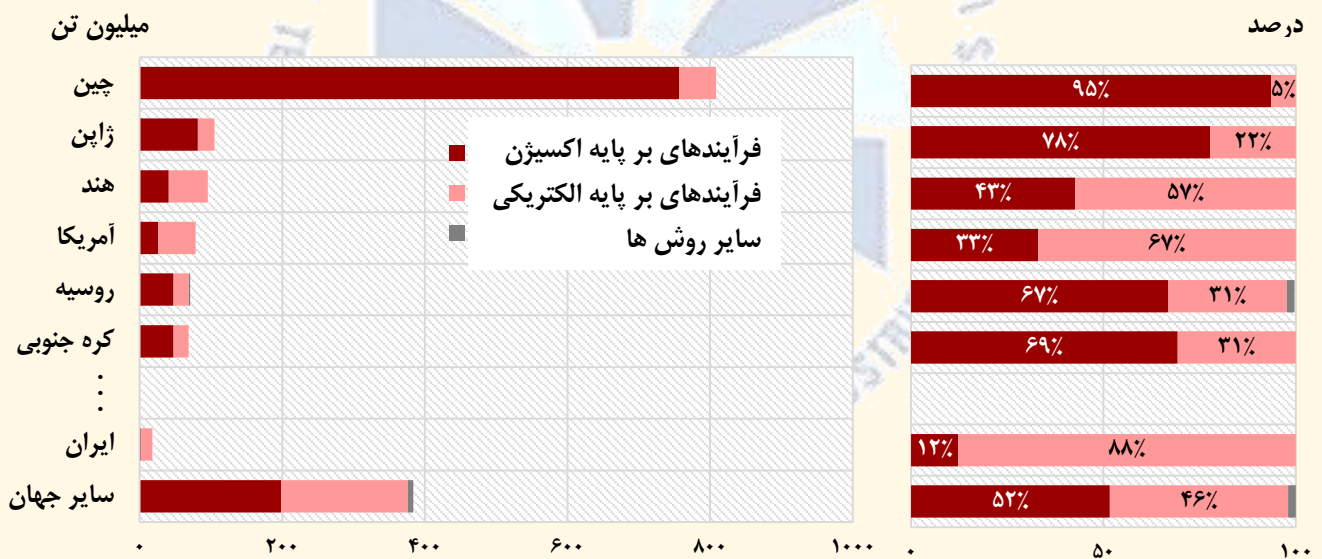
نمودار ۱- تولید جهانی فولاد و سهم روش های مختلف تولید در کشورهای منتخب - ۲۰۱۶