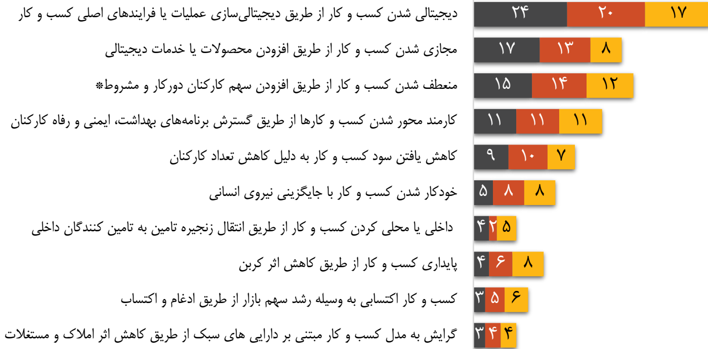
درصدی از پاسخ‌دهندگان

مدیران عامل برنامه‌ریزی می‌کنند تا محیط کاری منعطف‌تر و با محوریت نیروی کار داشته باشند: آنها سهم کارکنان دورکار یا مشروط را افزایش داده و برنامه‌های سلامت، ایمنی و رفاه کارکنان را افزایش می‌دهند.