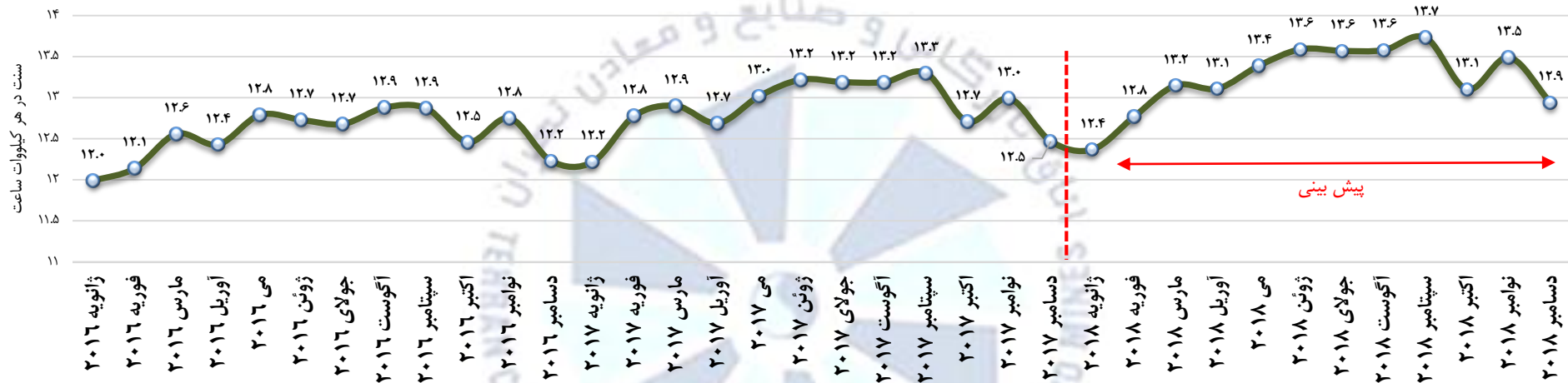
متوسط قیمت خرده فروشی برق در بخش خانگی در آمریکا