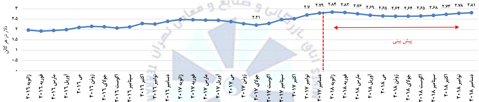
متوسط قیمت خرده فروشی نفت گرمایشی (با احتساب مالیات) در آمریکا

▪ قیمت خرده فروشی نفت گرمایشی آمریکا از جولای ۲۰۱۷ روندی صعودی در پیش گرفته و از ۲,۲۱ دلار به ازای هر گالن به ۲,۷۹ دلار در هر گالن در ماه دسامبر رسید. پیش بینی شده که این روند افزایشی قیمت تا فوریه ۲۰۱۸ نیز ادامه یابد. ▪ طبق پیش بینی سازمان اطلاعات انرژی آمریکا روند قیمت خرده فروشی نفت گرمایشی در ماه فوریه ۲۰۱۸ نسبت به ژانویه به کاهش حدود ۰,۷ درصدی مواجه خواهد شد و این کاهش قیمت تا ماه جولای ادامه خواهد یافت. پس از آن قیمت نفت گرمایشی مجدداً روند صعودی در پیش خواهد گرفت و در ماه دسامبر ۲۰۱۸ به ۲,۸۱ دلار در هر گالن می رسد. ▪ طبق پیش بینی ها، متوسط قیمت نفت گرمایشی در سال ۲۰۱۸، ۲,۷۲ دلار به ازای هر گالن می باشد که حدود ۲۷ سنت از متوسط سال ۲۰۱۷ بالاتر است.