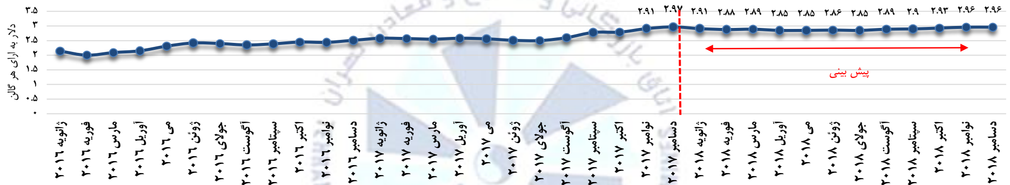
متوسط قیمت خرده فروشی سوخت دیزل (با احتساب مالیات) در آمریکا