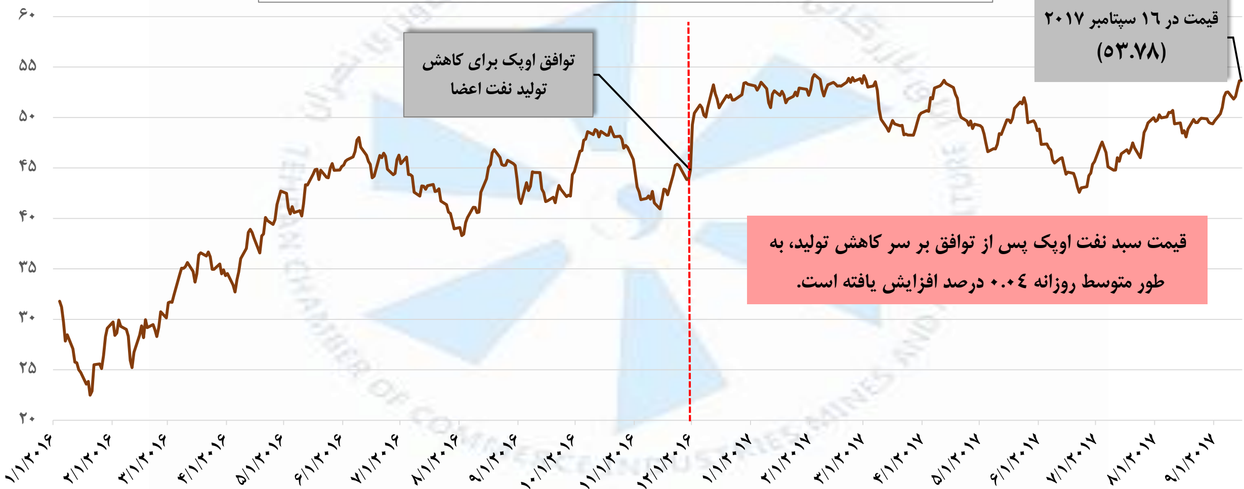
قیمت روزانه سبد نفت اوپک از ابتدای سال ۲۰۱۶ تا ۱۶ سپتامبر ۲۰۱۷، دلار در هر بشکه