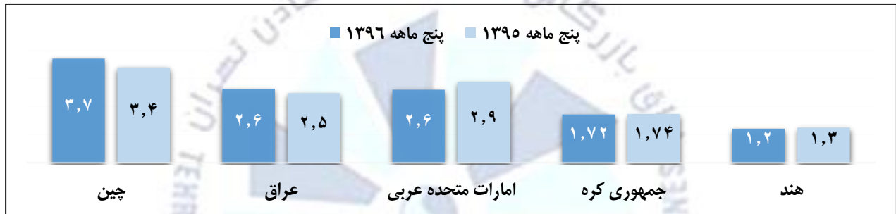
نمودار ۱- پنج مقصد عمده صادراتی ایران در پنج ماهه منتهی به مرداد ۱۳۹۶ - میلیارد دلار

نمودار ۱، پنج مقصد عمده صادراتی ایران در پنج ماهه سال ۱۳۹۶ را نشان می دهد. همانطور که مشاهده می شود، عراق، امارات متحده عربی، جمهوری کره و هند پس از چین، به ترتیب در رده های بعدی مقاصد عمده صادراتی کشور قرار دارند. به جز چین و عراق، صادرات ایران به سه کشور دیگر، نسبت به مدت مشابه سال ۱۳۹۵ با افت ارزشی مواجه بوده است.