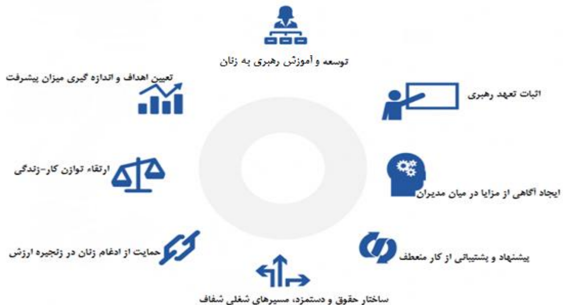
شکل ۲ - استراتژی های کسب و کار برای برقراری تساوی جنسیتی