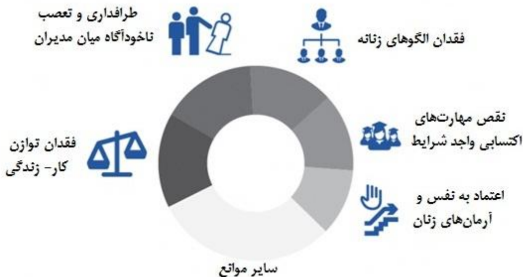
شکل ۱- موانع استخدام و ارتقای شغلی زنان