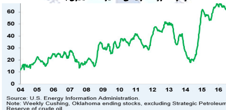
نمودار ۱- روند افزایشی ذخایر نفت میلیون بشکه

در حالی که انتظار می رفت کاهش سرمایه گذاری باعث کاهش تولید در اعضاء غیر اوپک در سال ۲۰۱۶ شود، میزان تولید همچنان از میزان مصرف بیشتر بود. برخی از کارشناسان حوزه نفت انتظار دارند تا بازار نفت در سال ۲۰۱۷ با سطح بالایی از موجودی، متوازن شود (نمودار ۱). عدم قطعیتی در رابطه با عرضه نفت به ویژه در مورد هزینه مربوط به استخراج و تولید نفت از حفاری ها و چاههای کامل نشده شل وجود دارد. این موضوع باعث خواهد شد تا دینامیک تولید نفت در مقایسه با منابع غیر متعارف تغییر یابد.