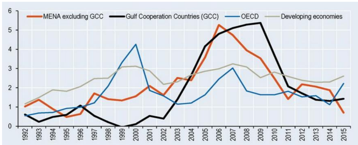
نمودار ۲- جریان ورودی سرمایه گذاری خارجی، سهم از GDP (درصد)