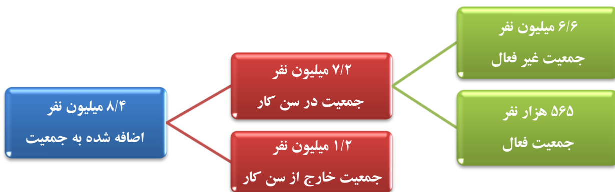
جدول ۲- میزان جمعیت فعال، جمعیت بیکار و تعداد شاغلان طی سالهای ۸۴ لغایت ۹۳